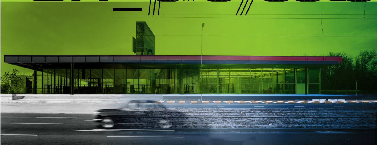
Neue Nationalgalerie. Mies van der Rohe. Berlin 1968